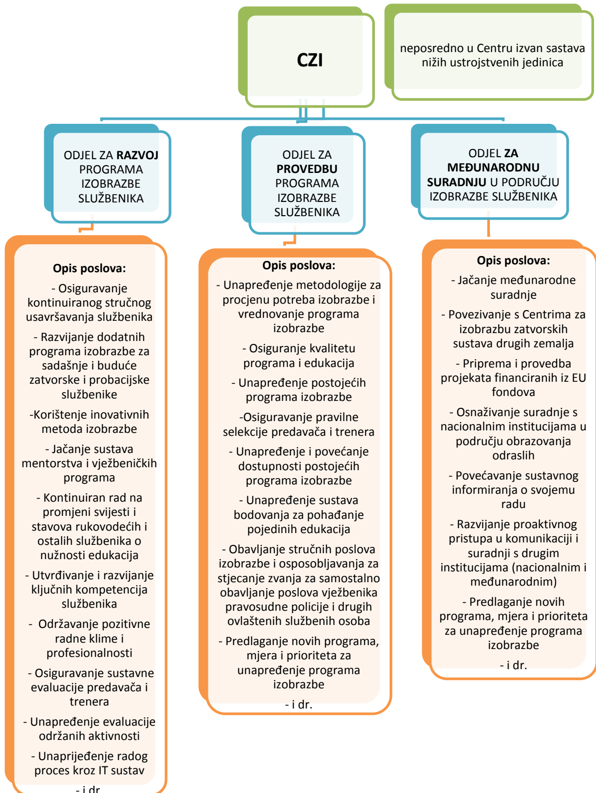
Slika 2. Poslovi pojedinih Odjela u Centru za izobrazbu